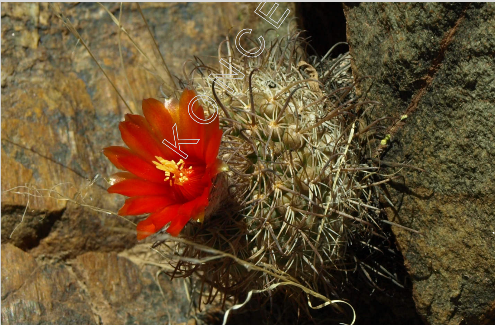
Parodia faustiana TB 8.2

Pro letošní přednášku si pro nás připravil průřez miniaturními taxony rodu Parodia , které rostou převážně v Argentině. Uvidíme jednotlivé rostliny, včetně jejich lokalit a dozvíme se plno dalších zajímavostí z cesty, kterou neobvykle podnikl s celou rodinou.